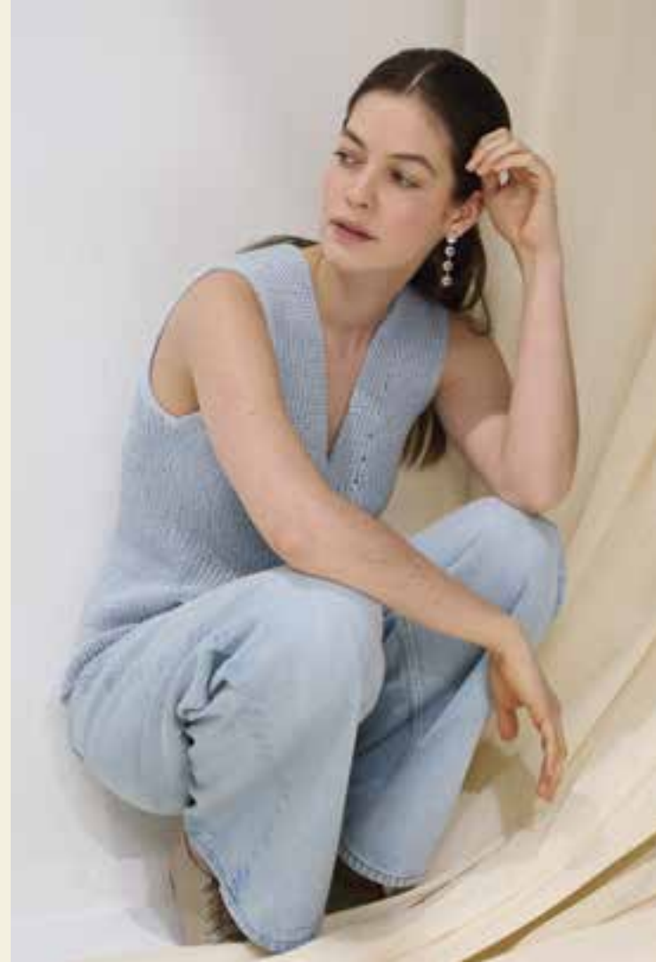
15_ LINKE SEITE: Top Down und im Rippenmuster gestrickt: Zeitloses Top mit V-Ausschnitt und extrabreiten Schultern LANDLUST BAUMWOLLE