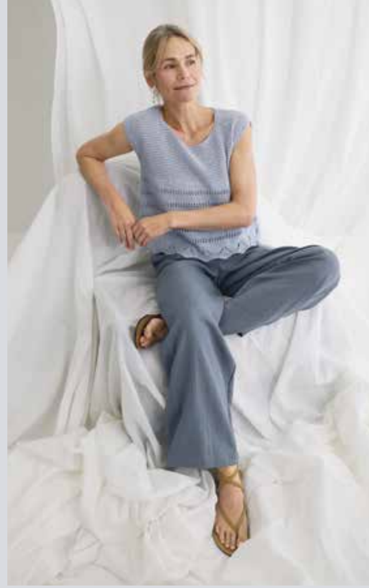
18_ RECHTE SEITE: Verspieltes Shirt im Mustermix, das gleichermaßen büro- wie alltagstauglich ist. COTTON WOOL