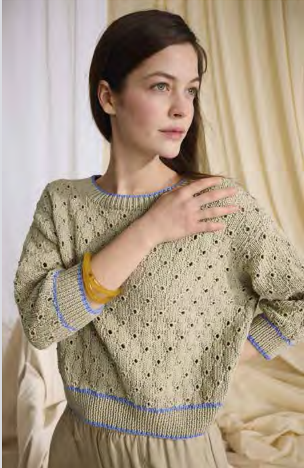
6_ LINKE UND RECHTE SEITE: Mädchenhaft verspielter Pullover mit Lochmuster und Dreiviertel-Arm. PROMESSA