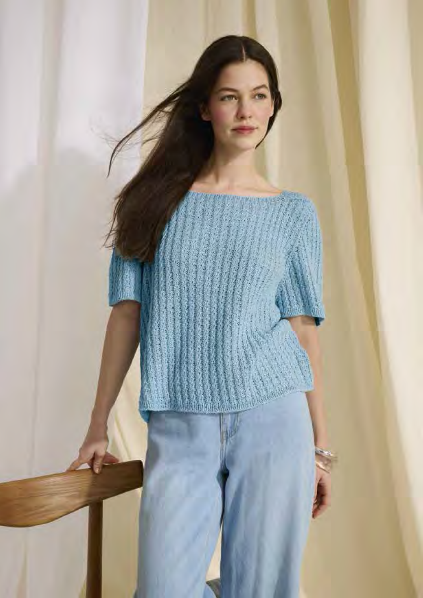
11_ LINKE SEITE: Lässiges Top Down- Shirt im Zopf-Rippen-Muster und abgesetztem Saum. CAMPO