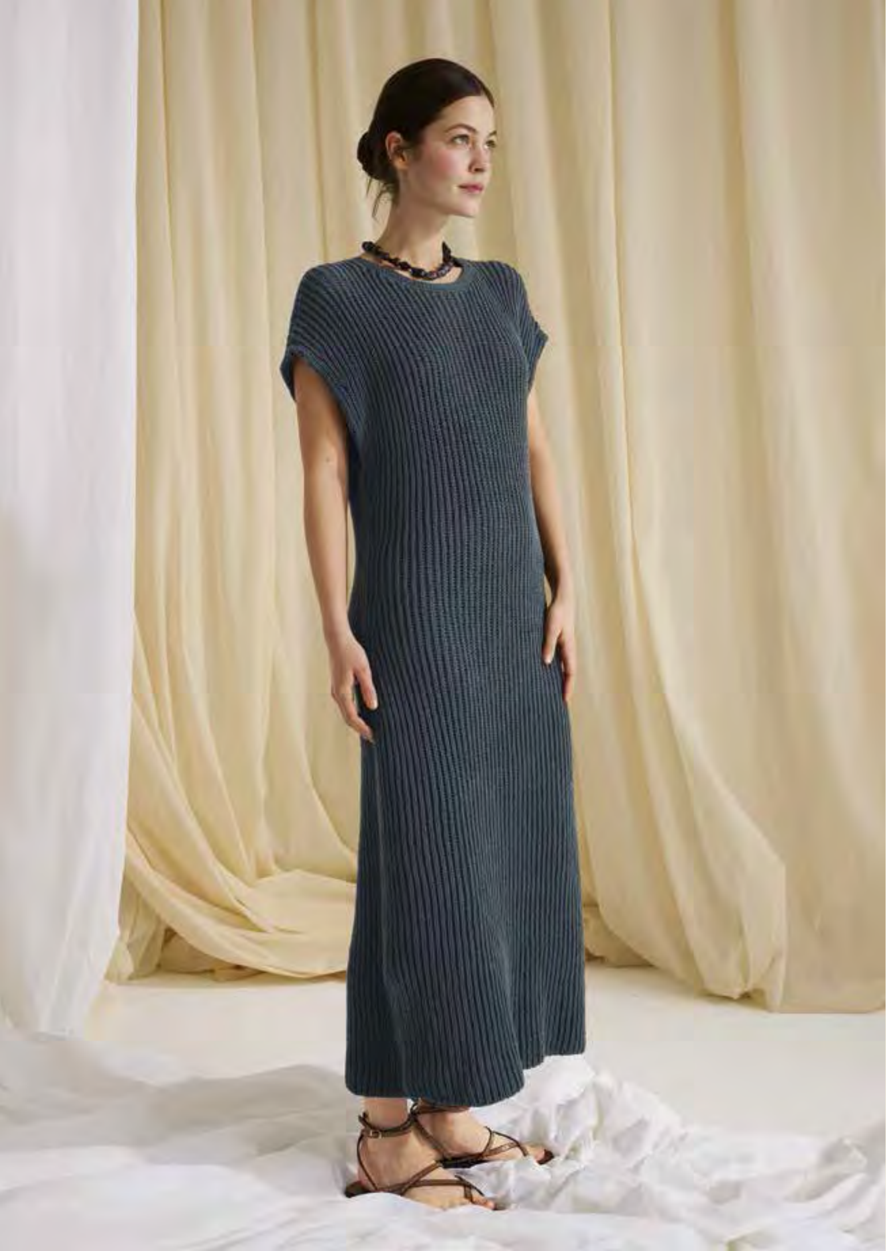
22_ LINKE SEITE: Tailliertes Shirt-Kleid im Patentmuster. ELASTICO