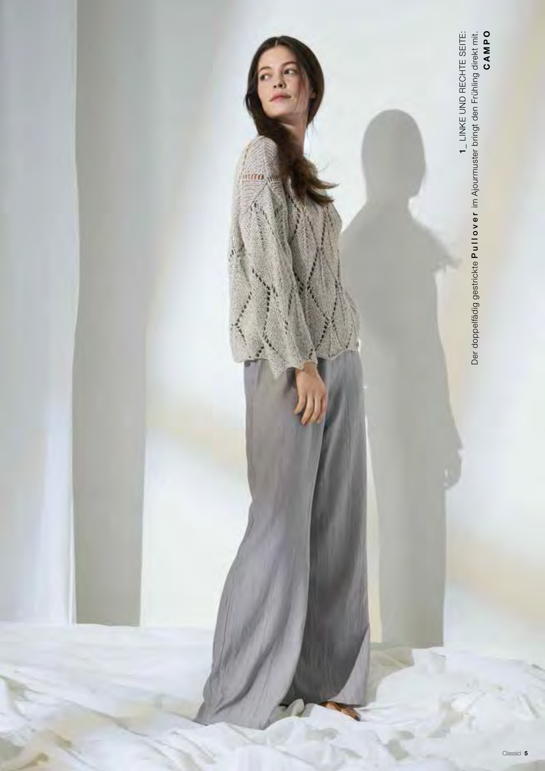
1_ LINKE UND RECHTE SEITE: Der doppelfädig gestrickte Pullover im Ajourmuster bringt den Frühling direkt mit. CAMPO