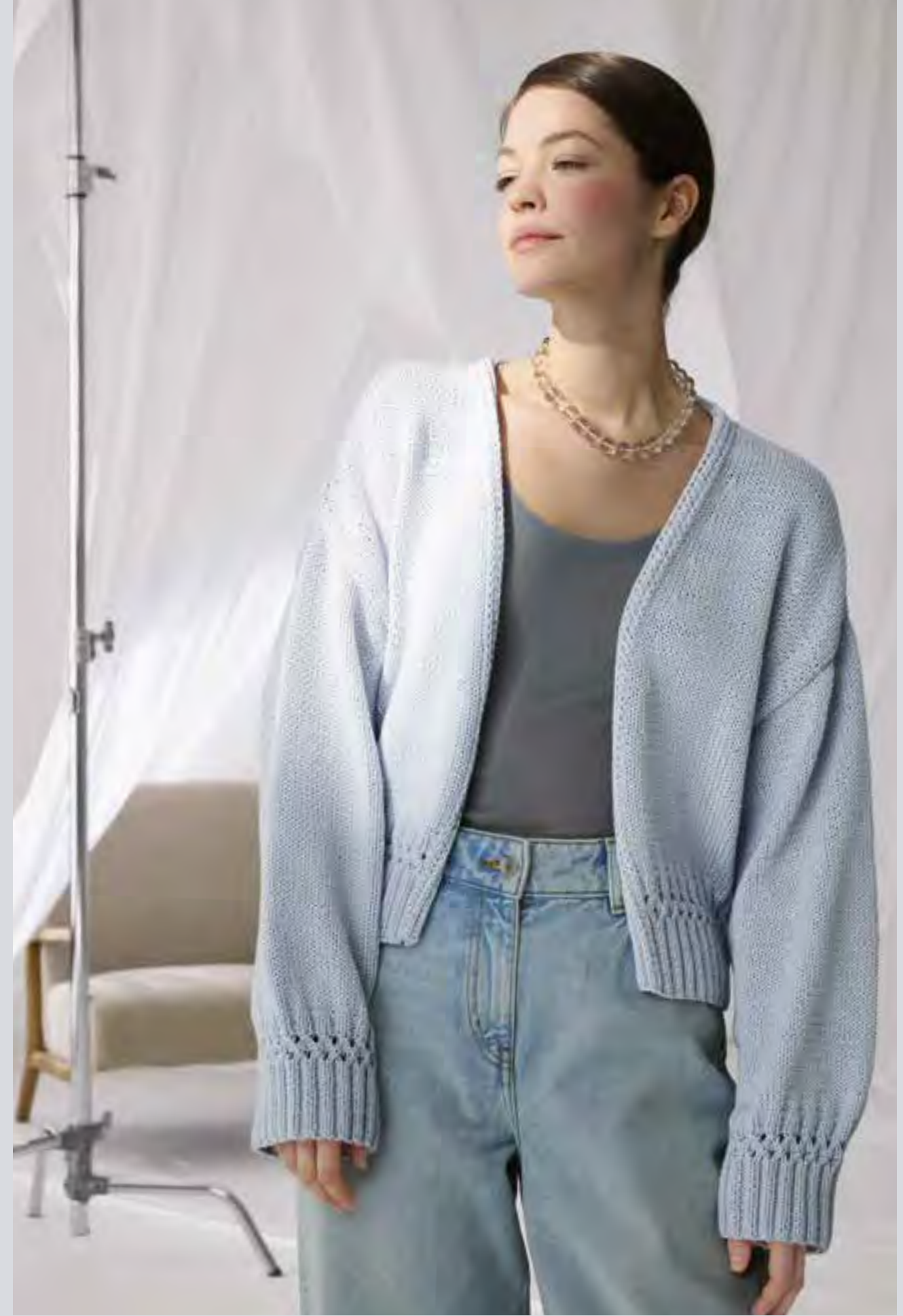
21_ RECHTE SEITE: Sofort gut angezogen ist man mit dem verschlusslosen Cardigan mit Lochmuster-Borte. PROMESSA