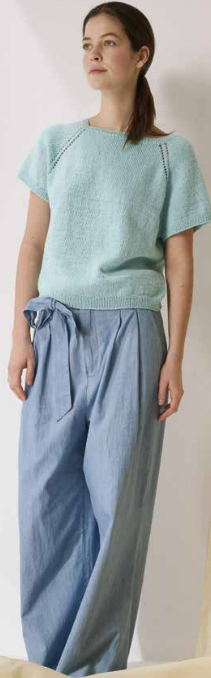
14_ RECHTE SEITE: Mit Raglanschräge im Lochmuster und abgesetzten Bündchen wird dieses schlichte Top Down-Shirt bald zum Lieblingsbasic. COTTON WOOL