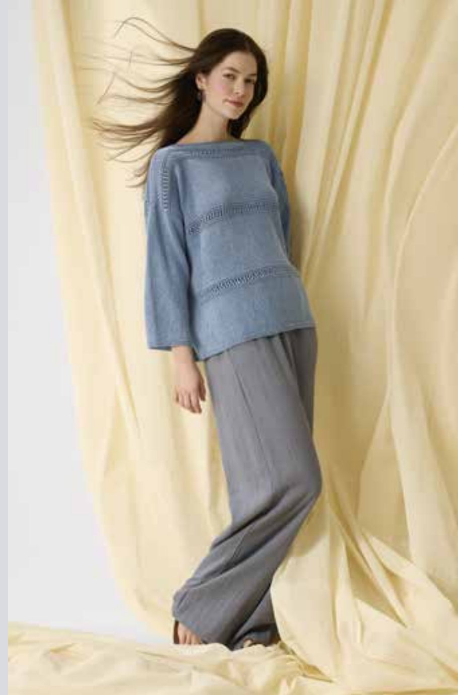
12_ RECHTE SEITE: Weite Ärmel, Lochmuster-Streifen und U-Boot-Ausschnitt geben dem Sweater Frühjahr-Vibes. SUMMER CASHMERE