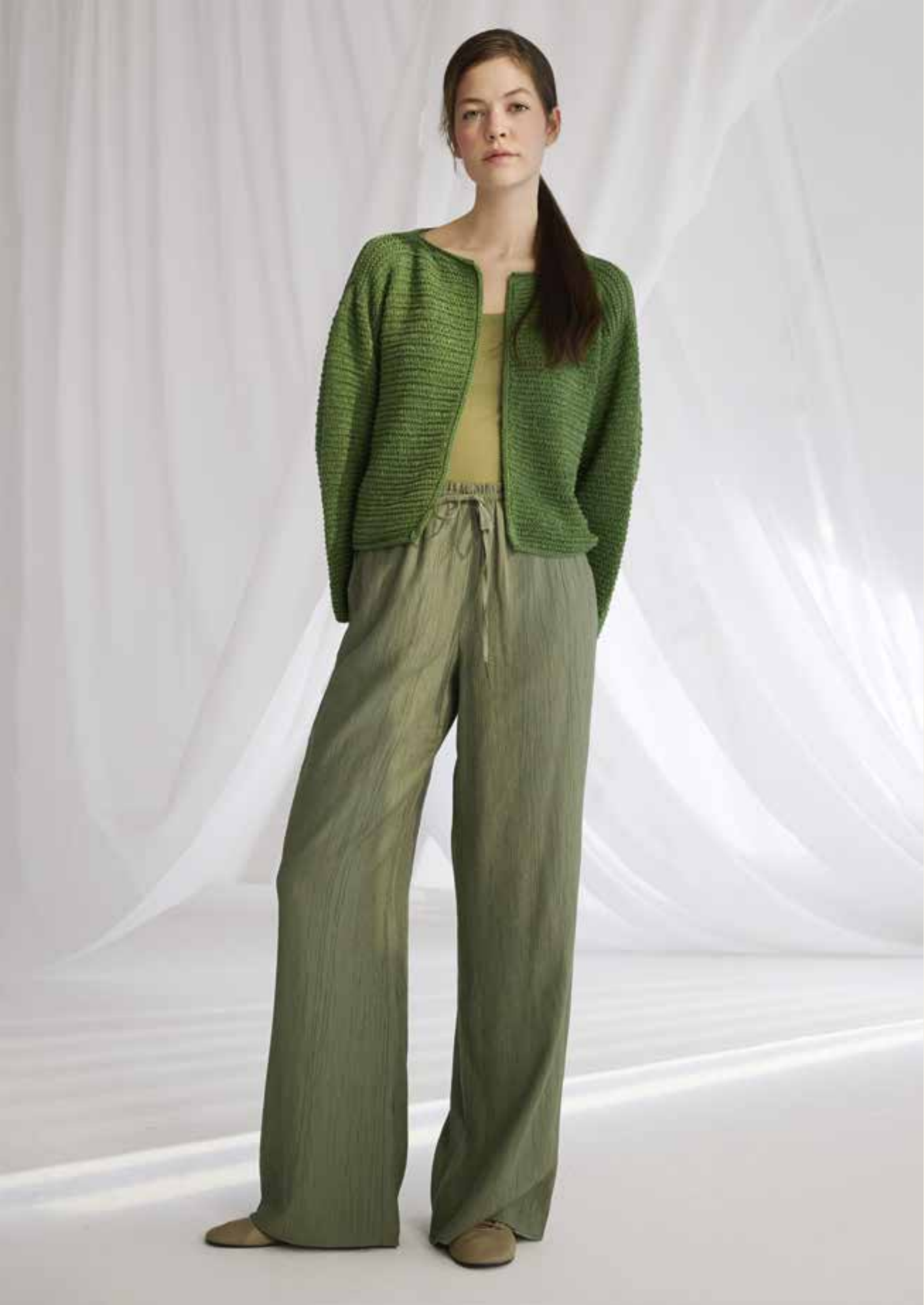
30_ LINKE SEITE: Top Down und im Fallmaschenmuster gestrickt, mit weiten Ärmeln und ohne Verschluss, bringt diese Jacke Minimalismus auf ein neues Level. LINARTE