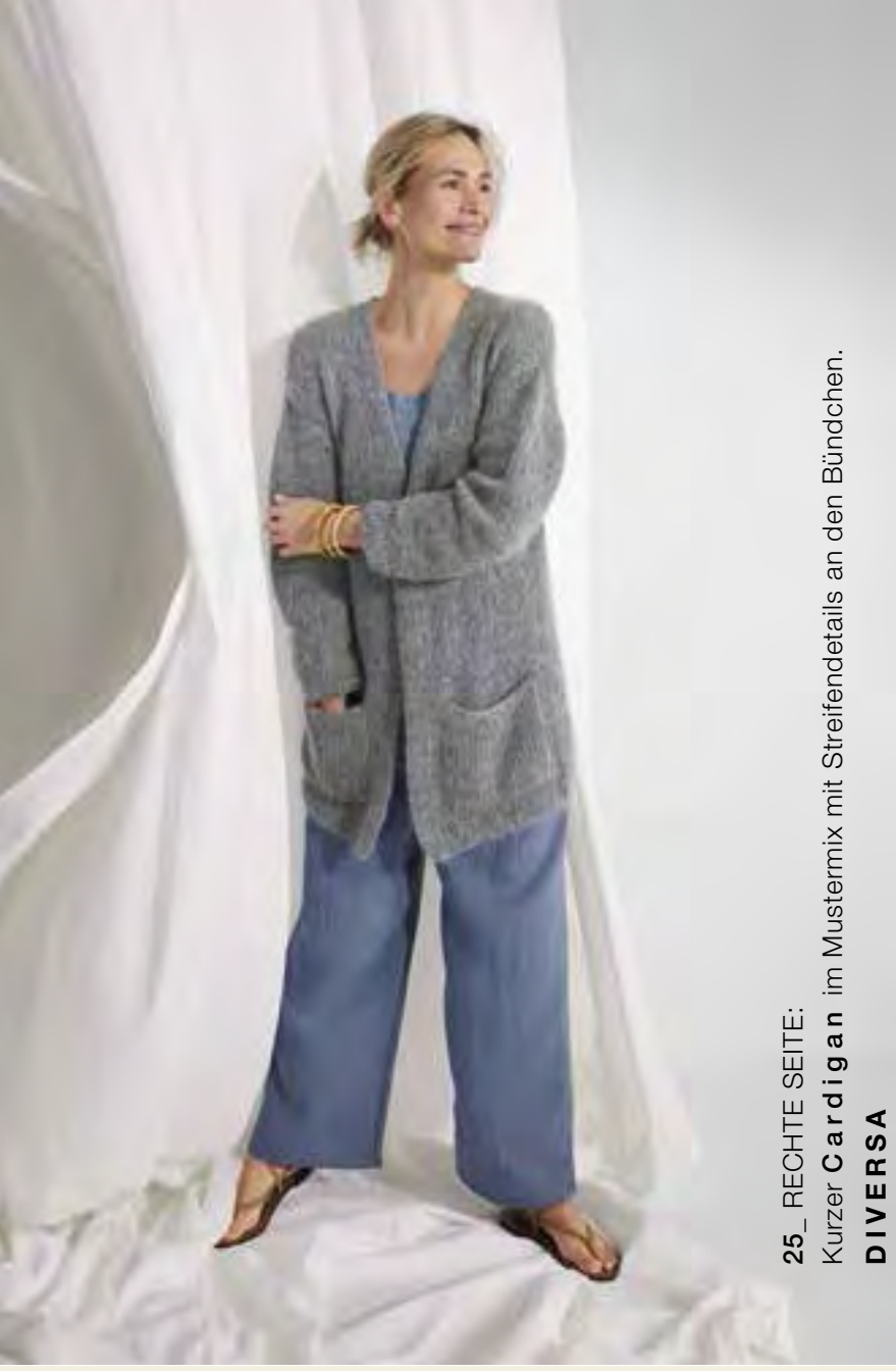
25_ RECHTE SEITE: Kurzer Cardigan im Mustermix mit Streifendetails an den Bündchen. DIVERSA