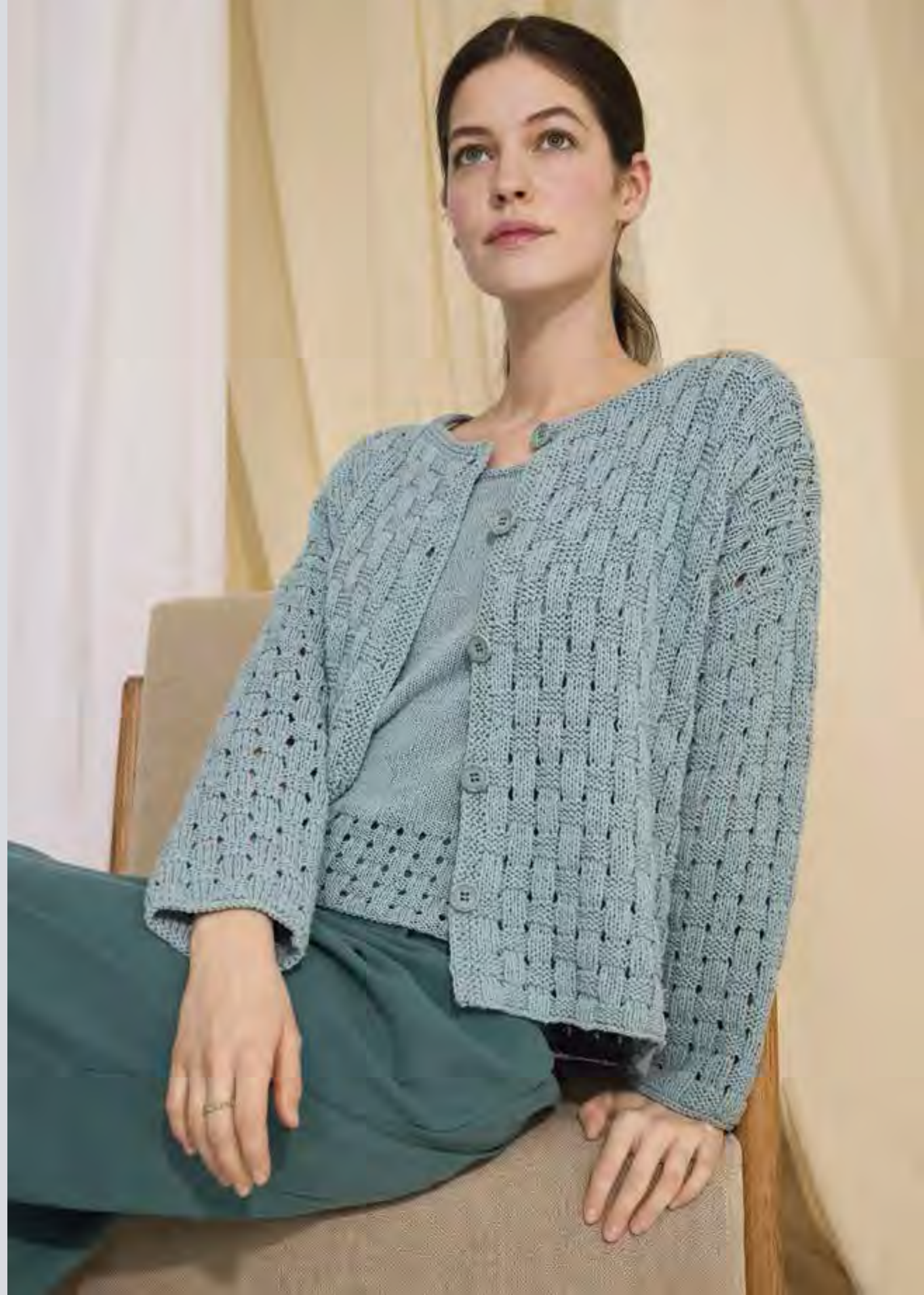
41/42_ LINKE UND RECHTE SEITE: Funktioniert einzeln genauso wie in Kombination: Das Twin Set bestehend aus Shirt mit geflochtener Blende und Jacke in großflächigem Flechtmuster. SETAPURA