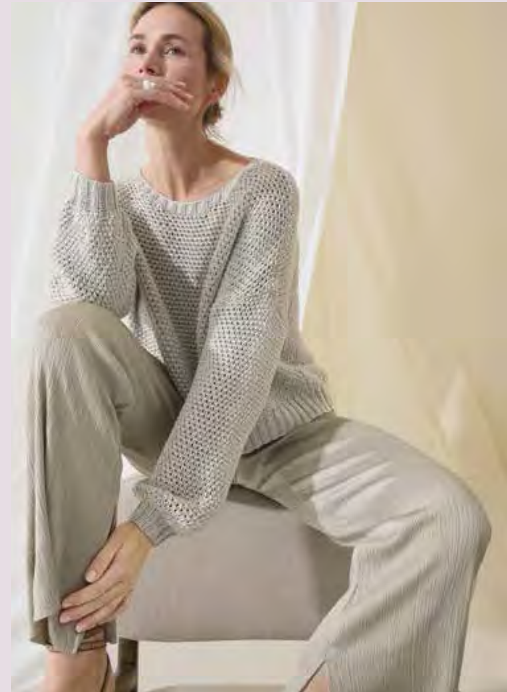
4_ RECHTE SEITE: Wie spannend schlicht sein kann beweist der Pullover im Strukturmuster mit gerippten Bündchen. COTTON SILK