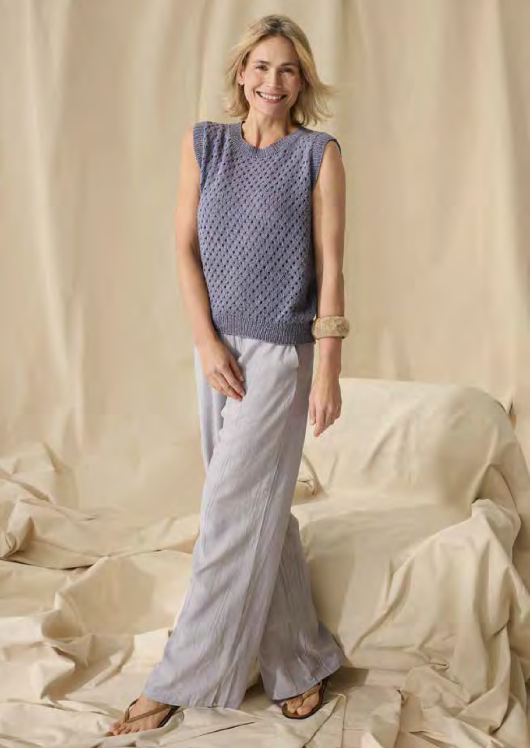
17_ LINKE SEITE: Leicht und luftig – Ärmelloses Top mit kleinem Lochmuster; Top Down gestrickt. DIVERSA