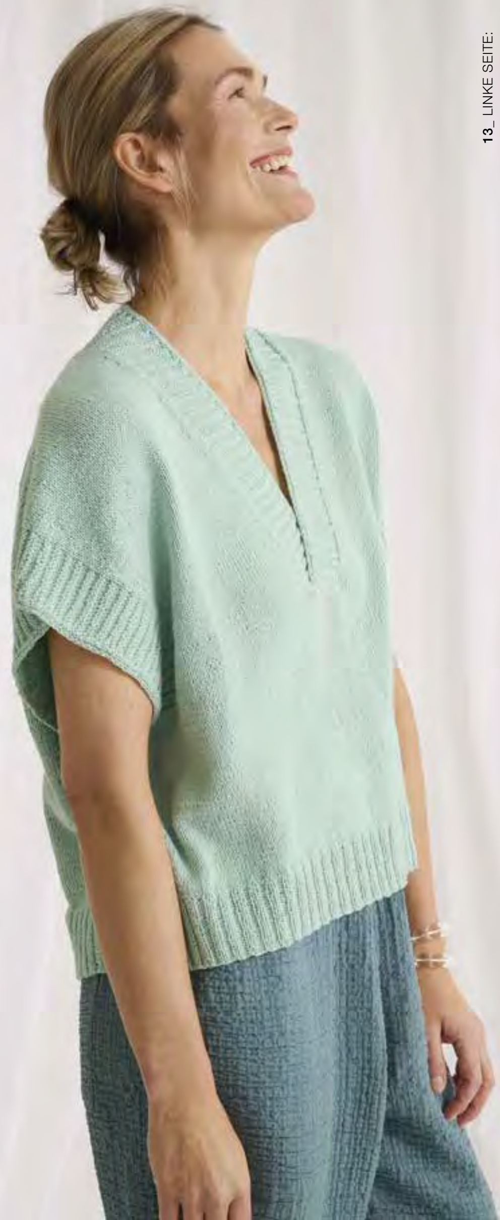
13_ LINKE SEITE: Oversize Deluxe: Pullunder mit tiefem V-Ausschnitt und überschnittenen Schultern. SUMMER CASHMERE