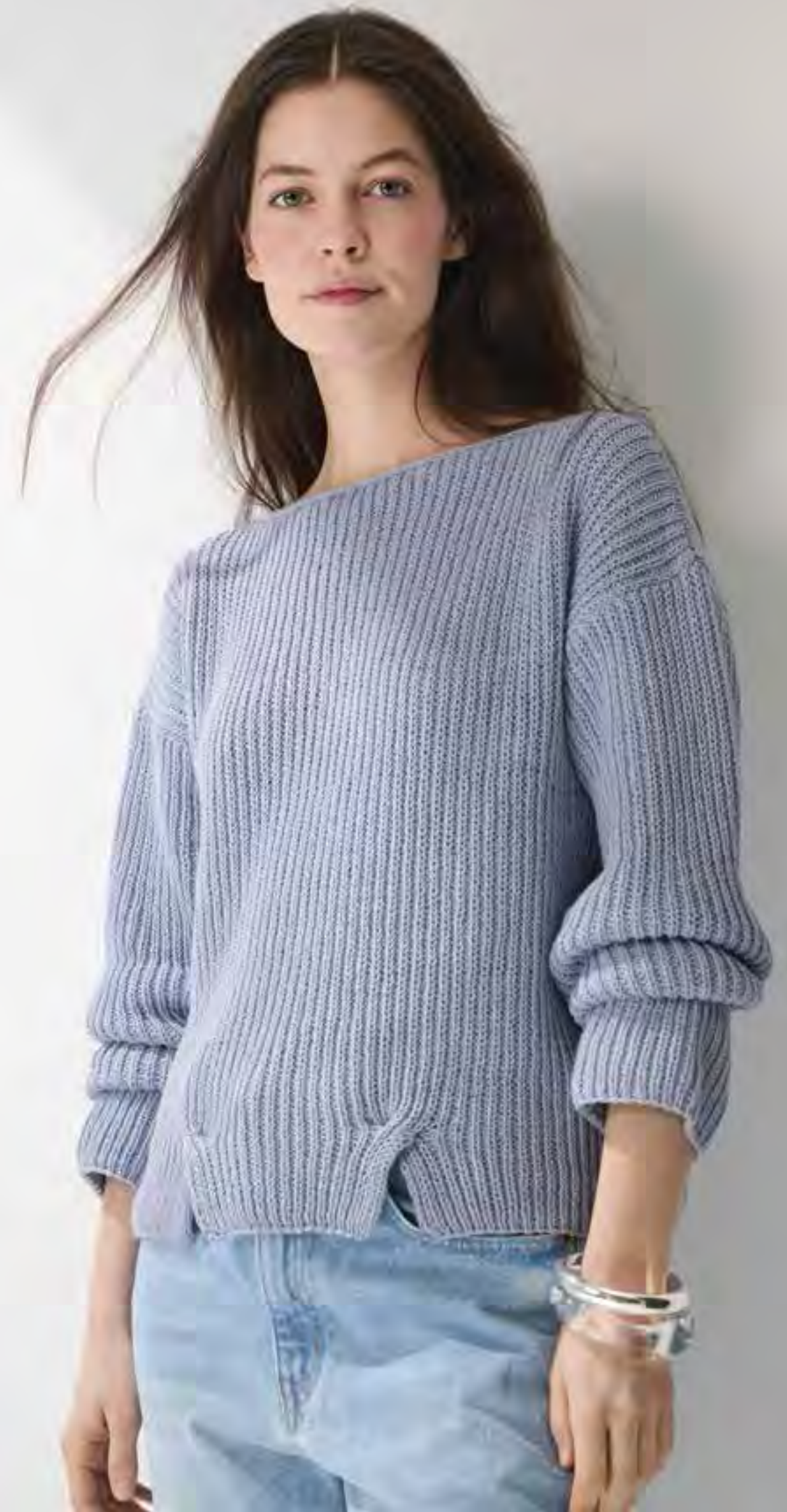
16_ RECHTE SEITE: Die Zopfdetails am Bund geben dem im Halbpantent gestrickten Pullover das gewisse Etwas. ELASTICO