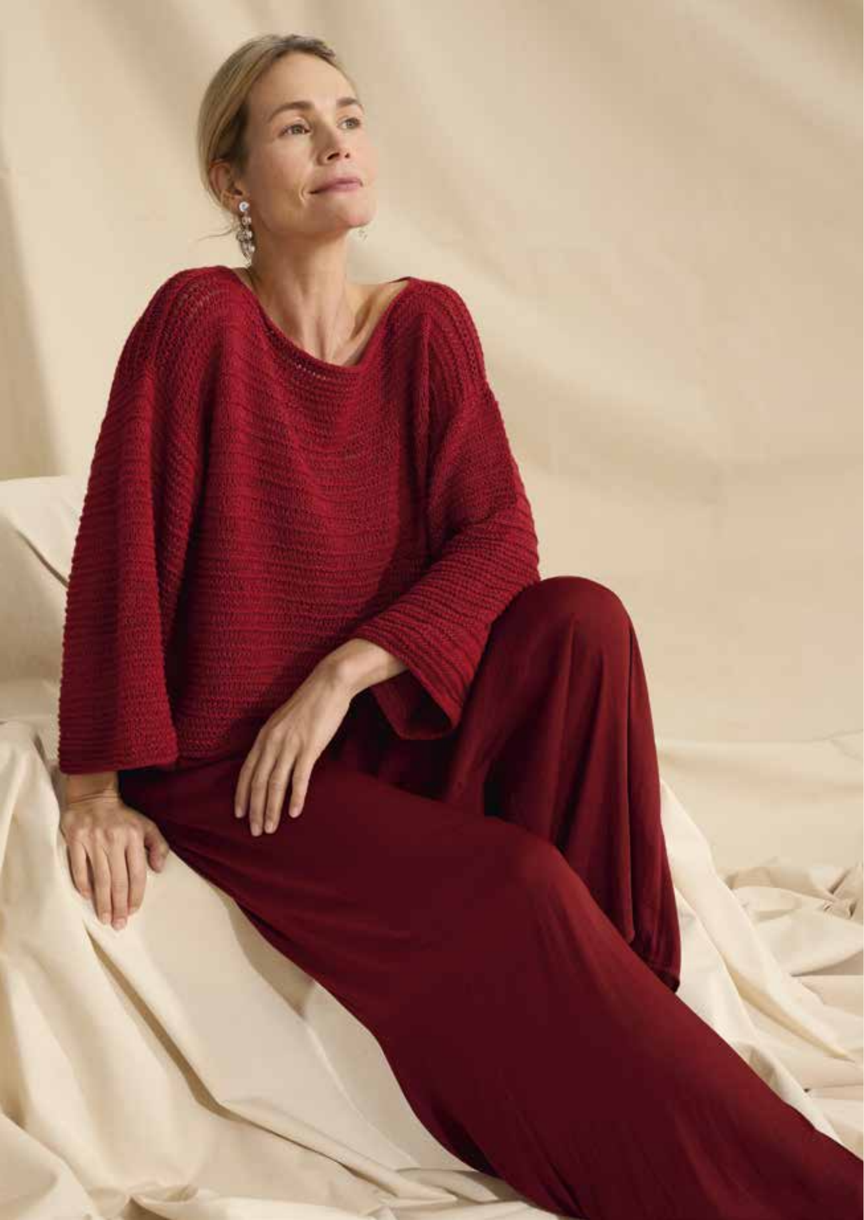
32_ LINKE UND RECHTE SEITE: Klassischer Pullover im Fallmaschenmuster; Top Down gestrickt und mit geradem Ausschnitt. LINARTE