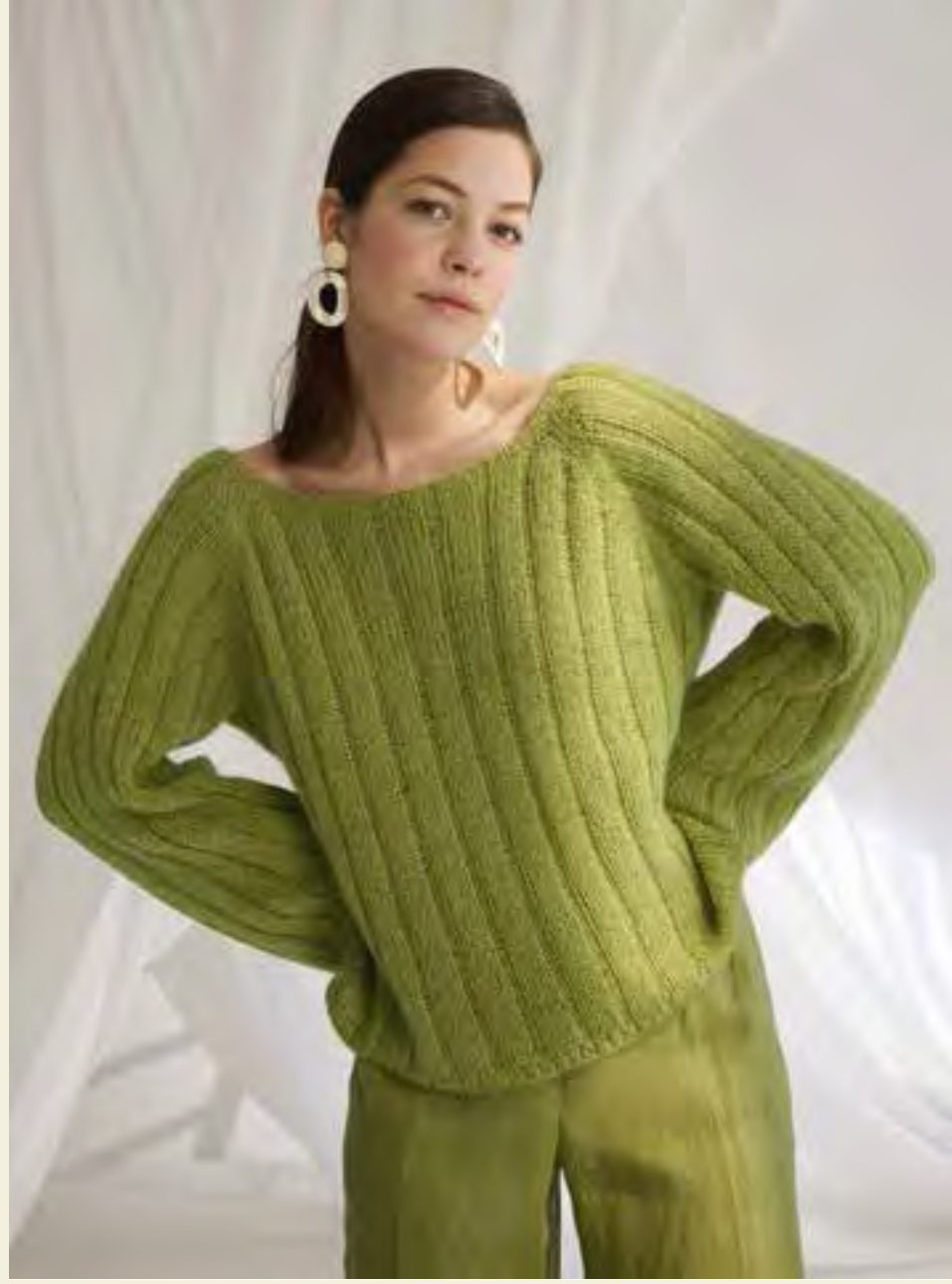
31_ RECHTE SEITE: Pullover mit breiten Rippen, überlangen Ärmeln und Wow-Effekt. CAMPO & SILKHAIR