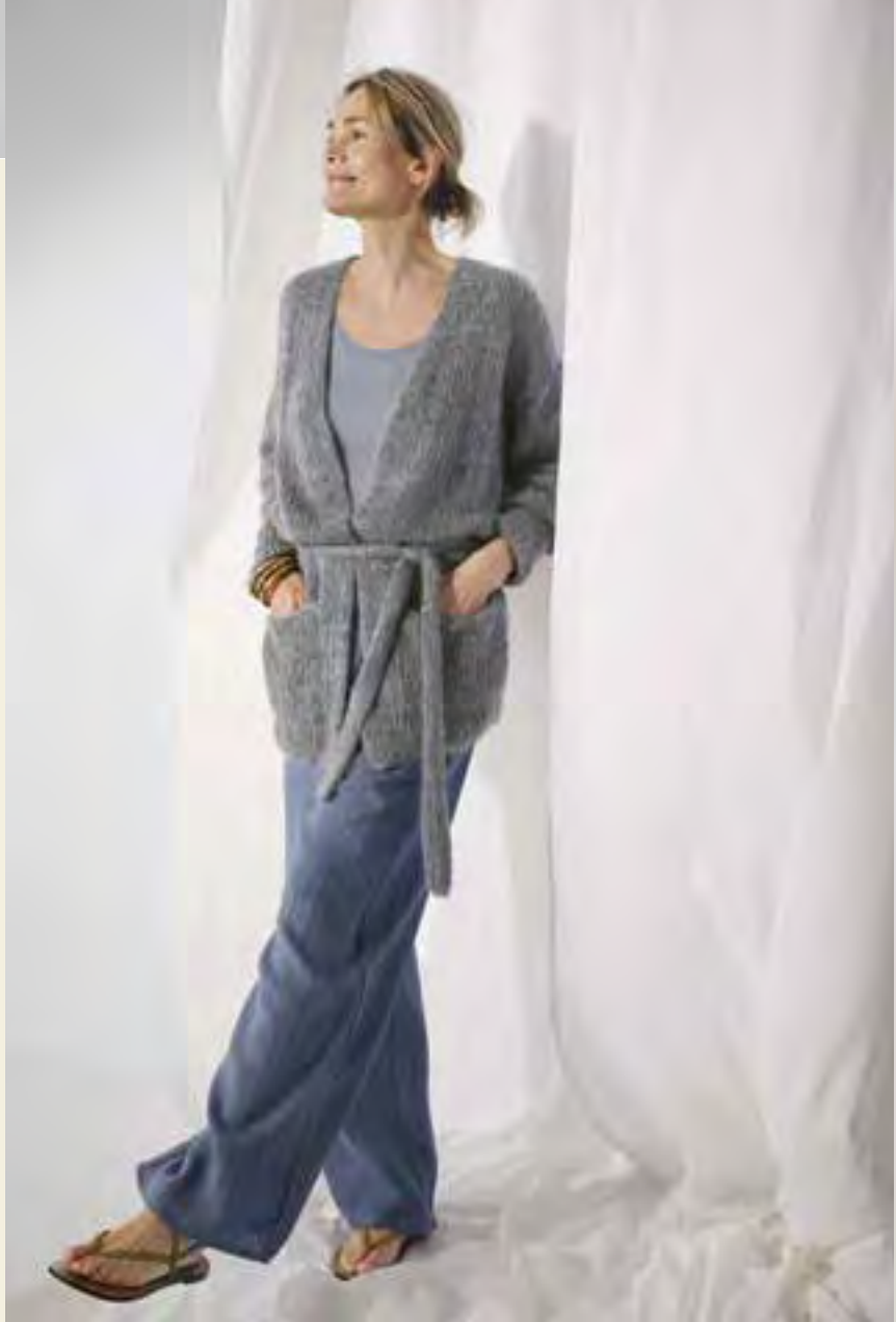
24_ LINKE SEITE: Perfekt für Sommer, Herbst und Winter: Gemütliche Jacke mit Gürtel. ALTA MODA COTOLANA & SILKHAIR