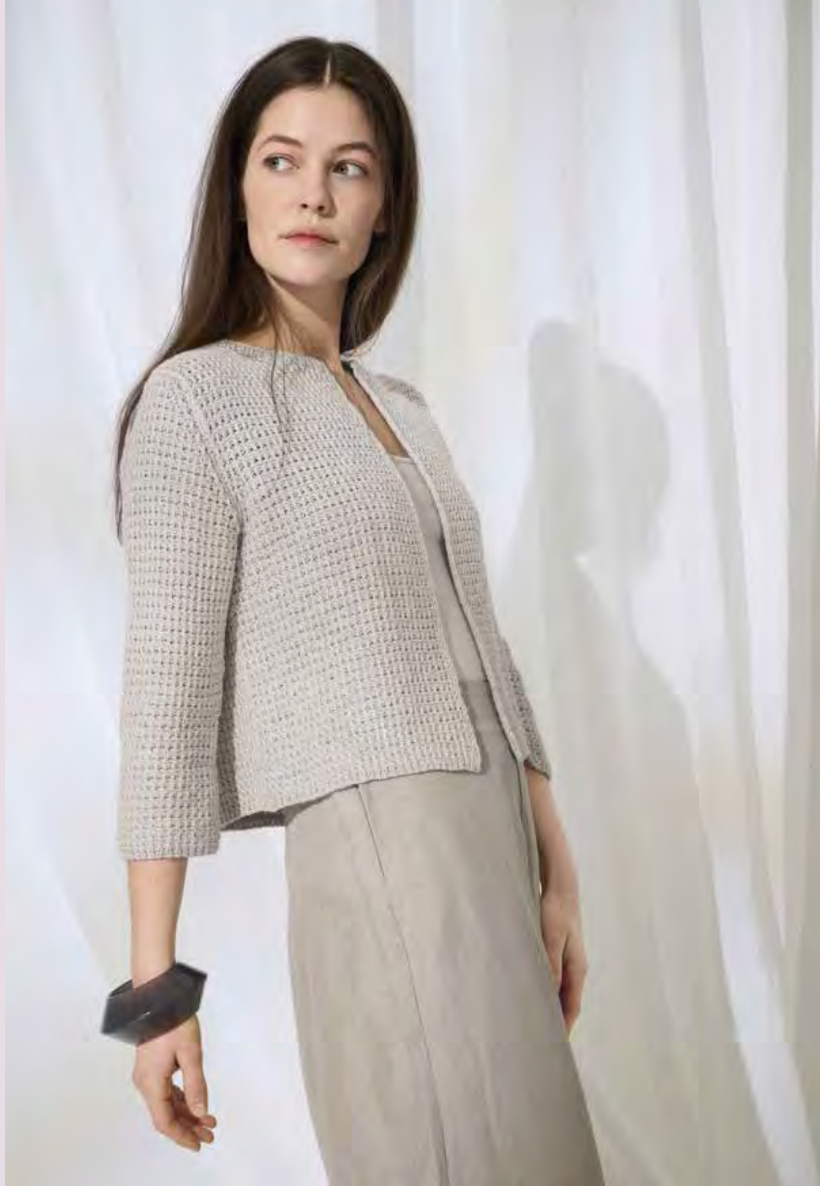
3_ LINKE SEITE: Understatement für Fortgeschrittene: Jäckchen im Webmuster mit Dreiviertel-Ärmeln. SUMMER CASHMERE