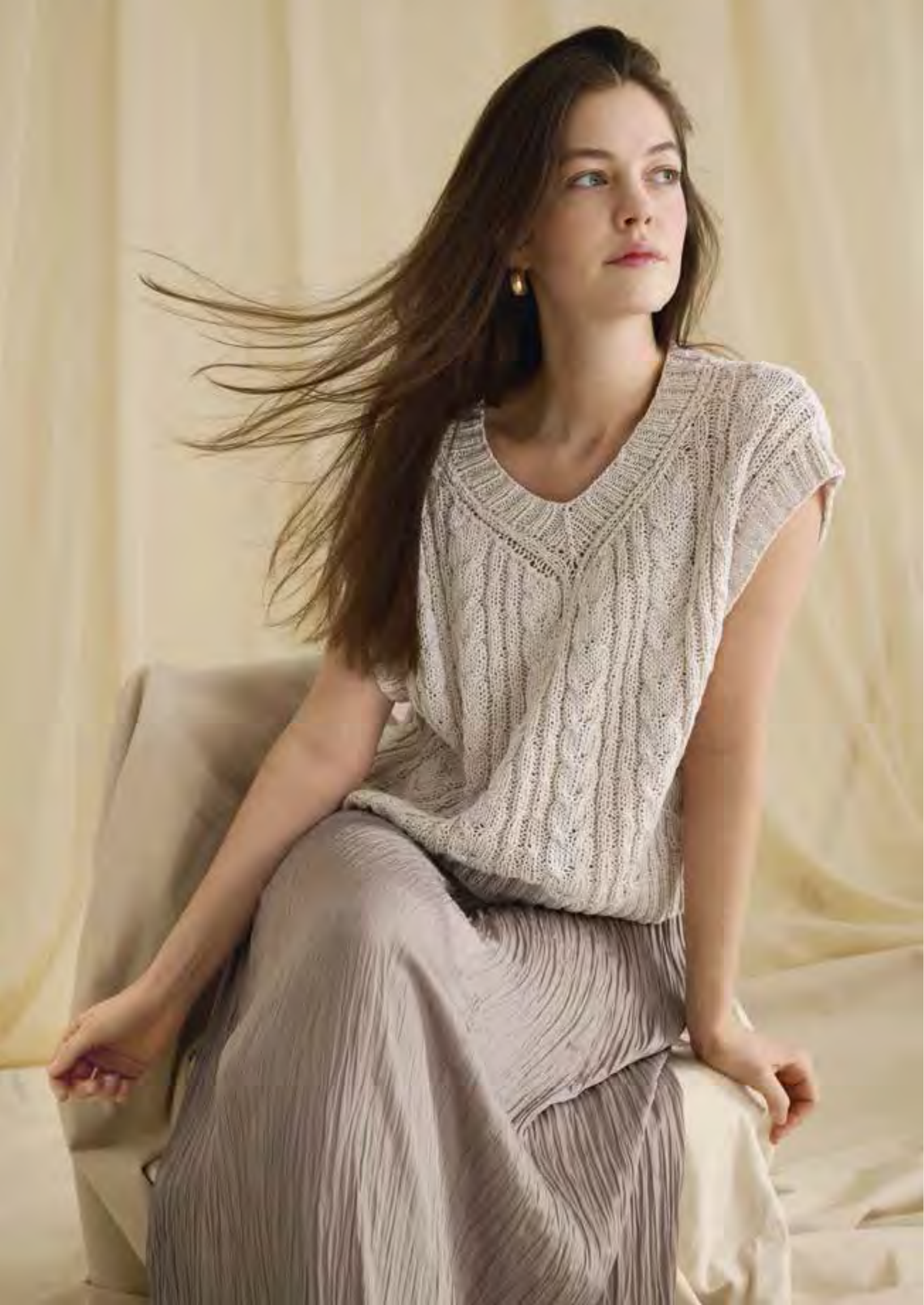
7_ LINKE UND RECHTE SEITE: Kastiges Top mit V-Ausschnitt und abwechselnd breiten und schmalen Zöpfen. COTTON SILK