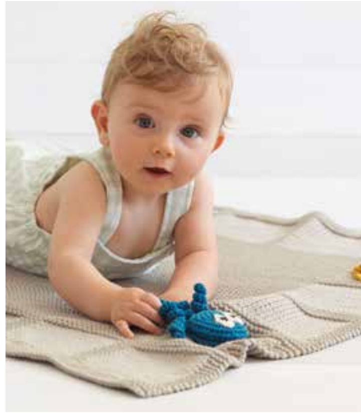
22 + 23 Bilderbuch und Decke – THE TUBE FINE + COTONE | 24 Strampler – COOL WOOL BABY