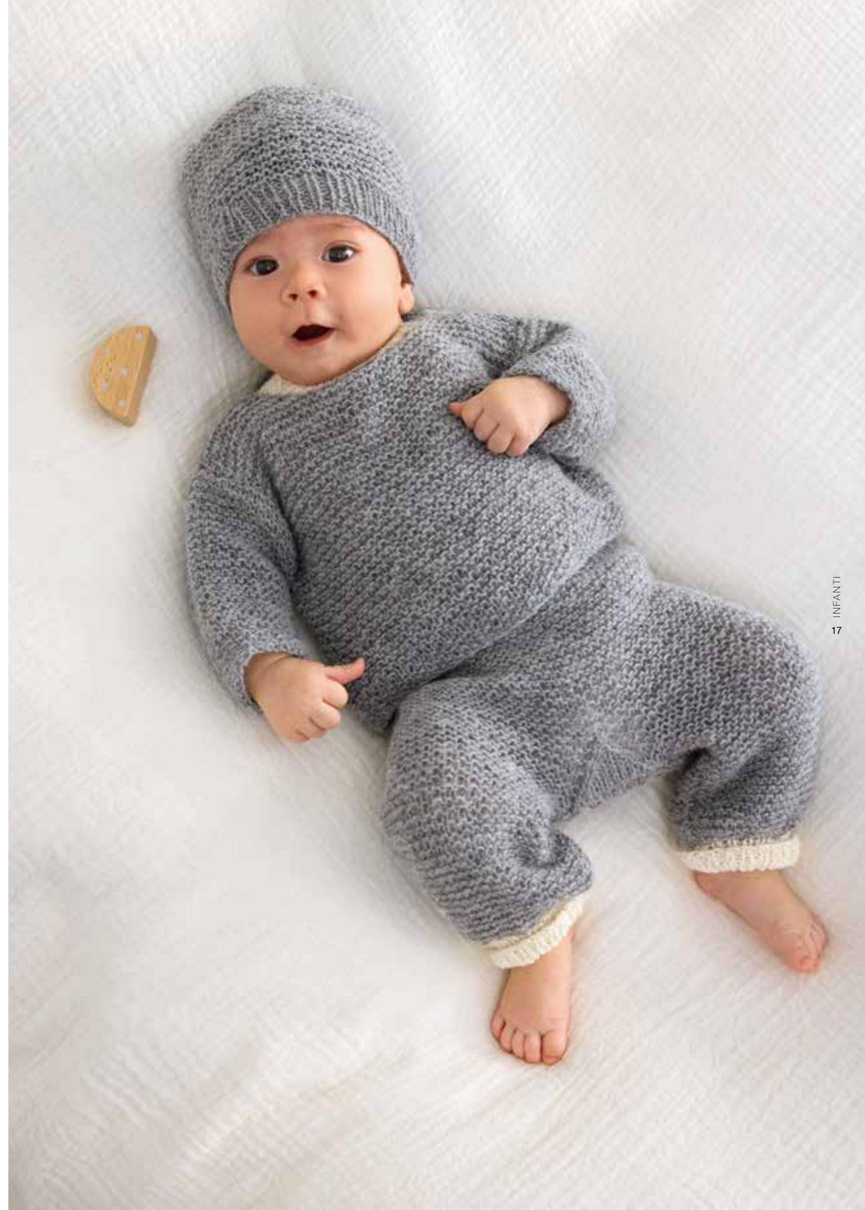
15 + 16 + 17 + 18 Decke, Mütze, Pullover und Hose – COOL WOOL BABY