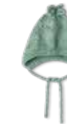
35 NATURAL SUPERKID TWEED + ECOPUNO