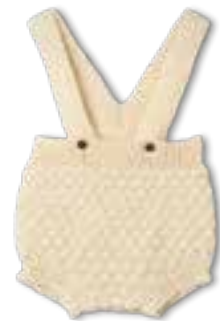
14 COOL WOOL BABY