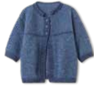
11 NATURAL SUPERKID TWEED + COOL WOOL BIG VINTAGE