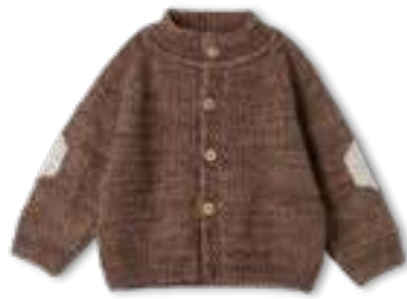
04 COOL WOOL BIG VINTAGE + COOL WOOL BIG