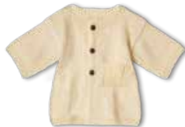
13 COOL WOOL BABY