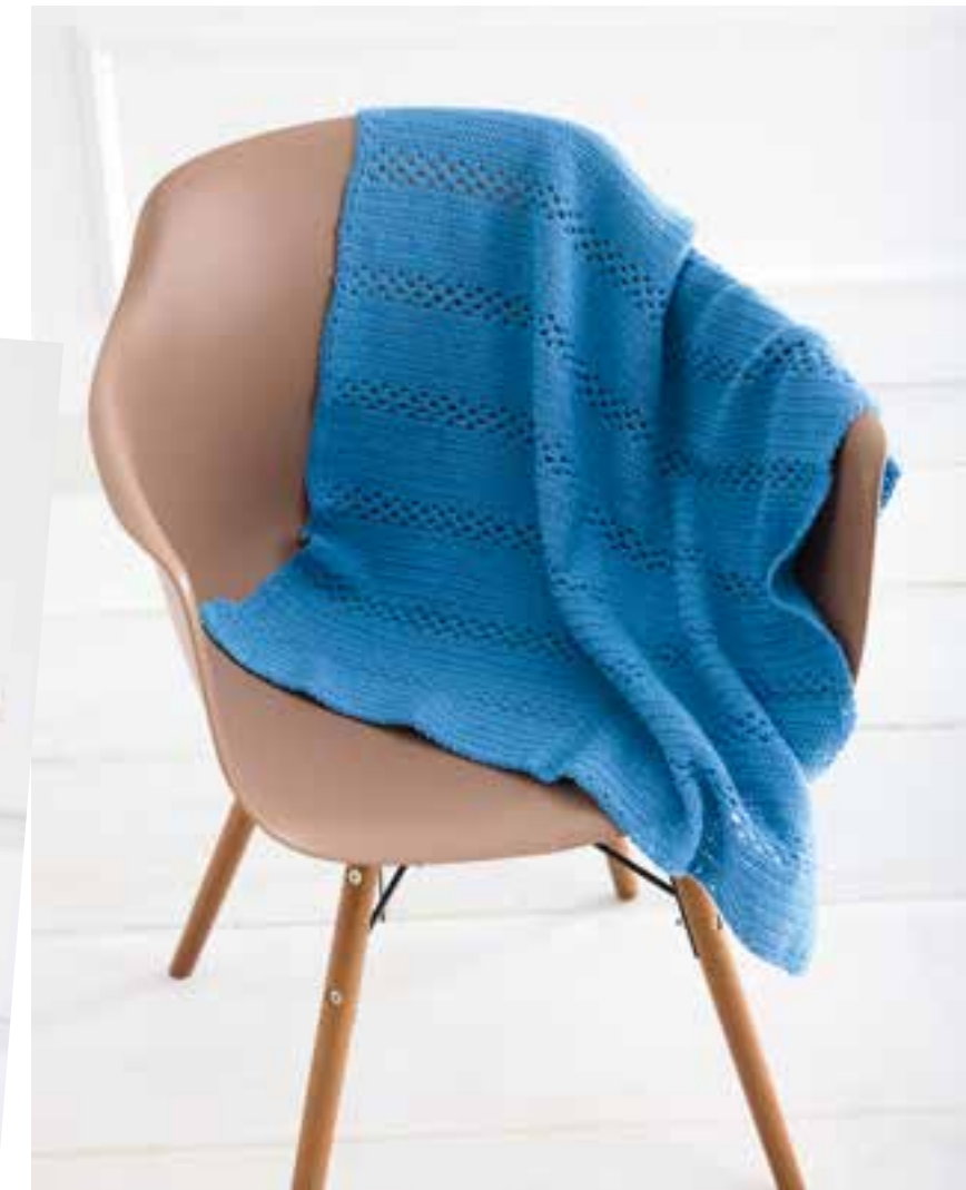
19 Shirt – SOTTILE + ECOPUNO | 20 + 21 Shorts und Decke – SOTTILE