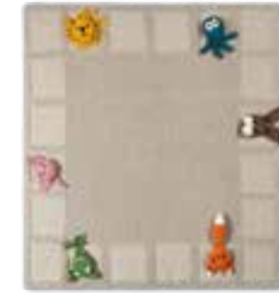
23 THE TUBE FINE + COTONE