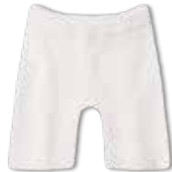
06 COOL WOOL BABY