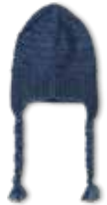
10 COOL WOOL BIG VINTAGE