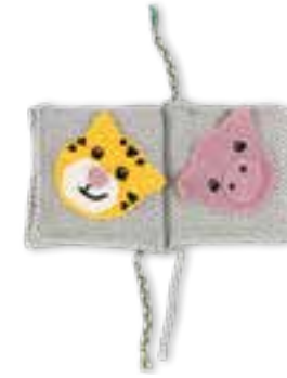
22 THE TUBE FINE + COTONE