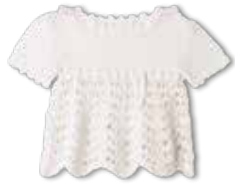
05 COOL WOOL BABY