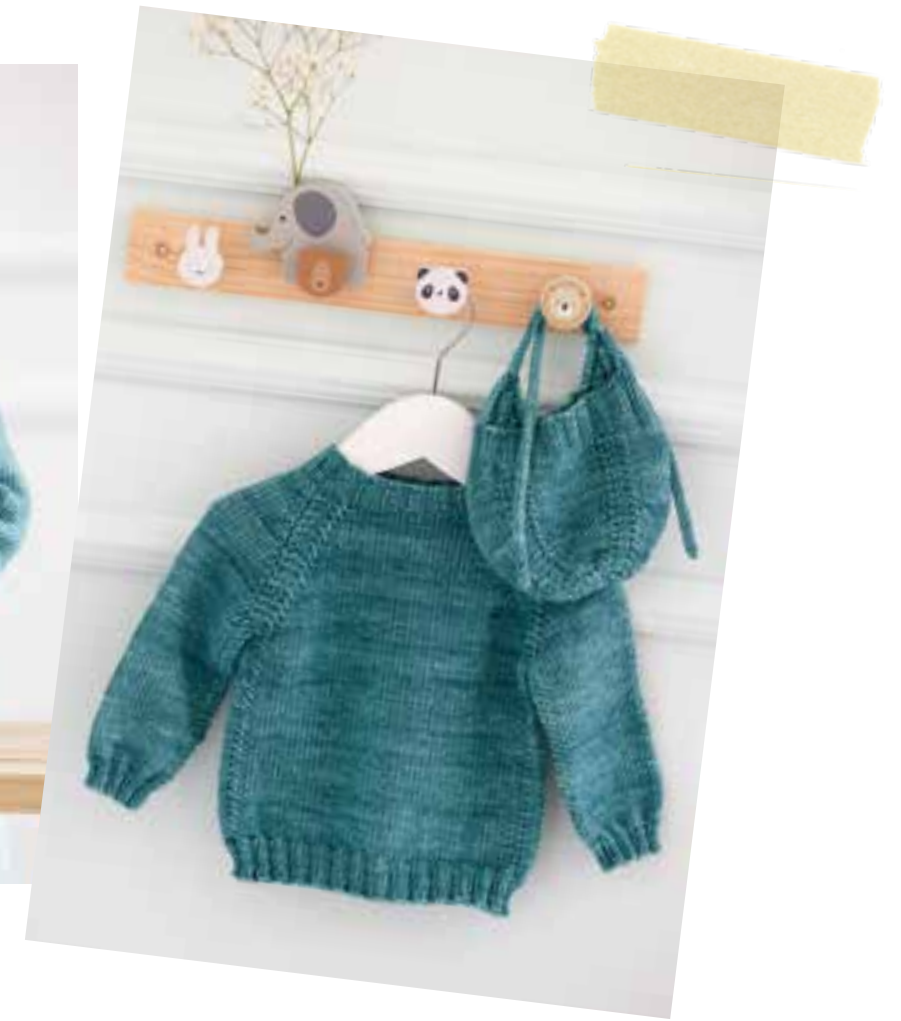
31 + 32 Mütze und Pullover – COOL WOOL BIG VINTAGE | 33 Jacke – PER FORTUNA + ECOPUNO