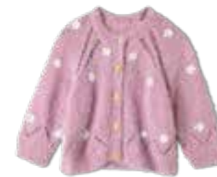
33 PER FORTUNA + ECOPUNO