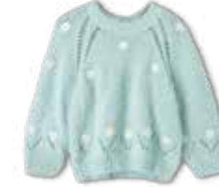
30 PER FORTUNA + ECOPUNO