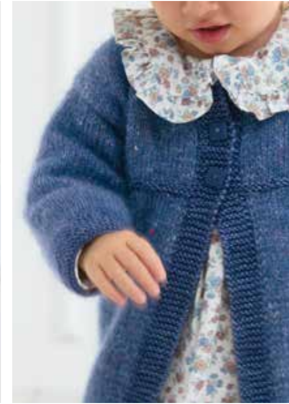
10 Mütze – COOL WOOL BIG VINTAGE | 11 Jacke – NATURAL SUPERKID TWEED + COOL WOOL BIG VINTAGE | 12 Pullunder – COOL WOOL VINTAGE