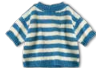
19 SOTTILE + ECOPUNO