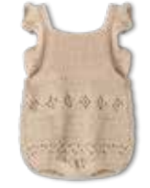
24 COOL WOOL BABY