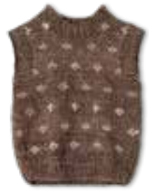
02 COOL WOOL BIG VINTAGE + COOL WOOL BIG