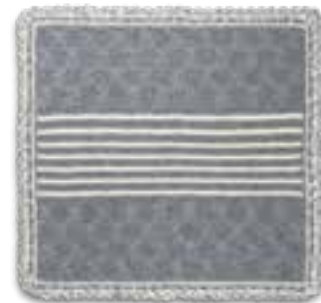
15 COOL WOOL BABY