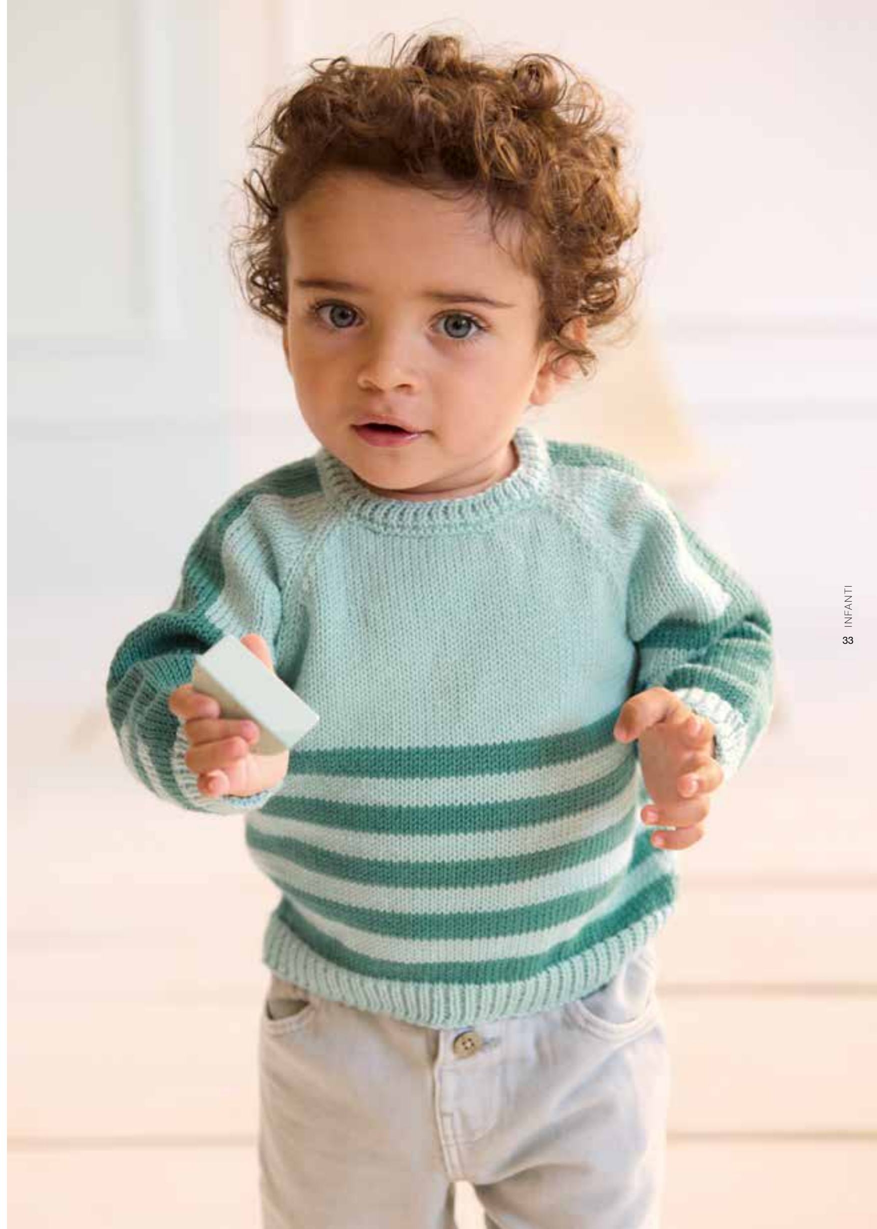
34 + 35 Pullover und Mütze – NATURAL SUPERKID TWEED + ECOPUNO rechte Seite: 36 Pullover – COOL WOOL