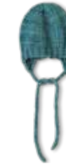
31 COOL WOOL BIG VINTAGE