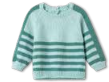
36 COOL WOOL