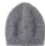
16 COOL WOOL BABY