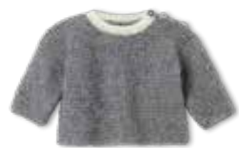
17 COOL WOOL BABY