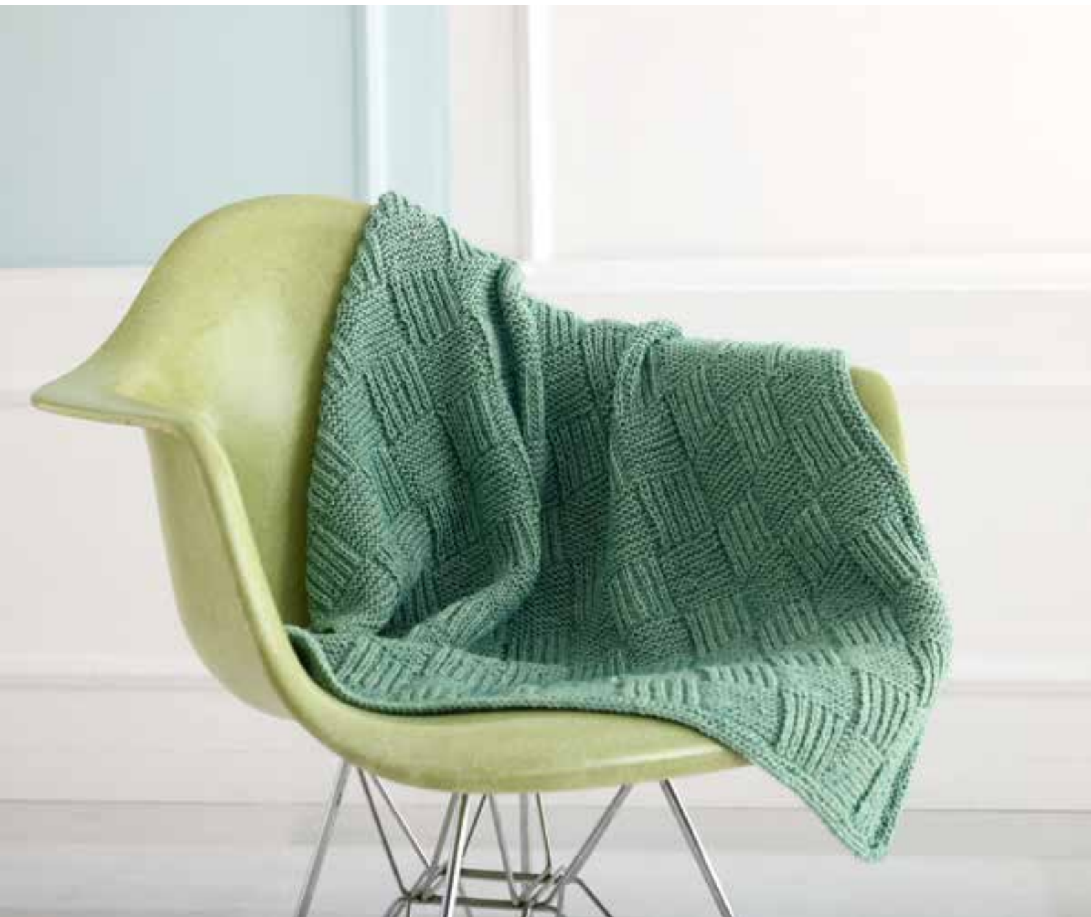
08 + 09 Decke und Kleid – ECOPUNO