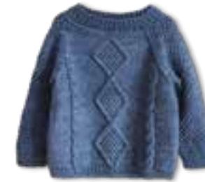
25 COOL WOOL BIG VINTAGE