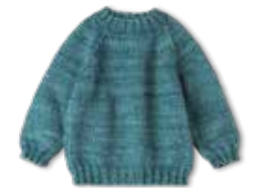
32 COOL WOOL BIG VINTAGE