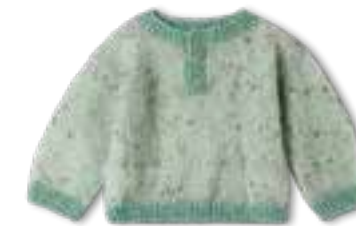
34 NATURAL SUPERKID TWEED + ECOPUNO