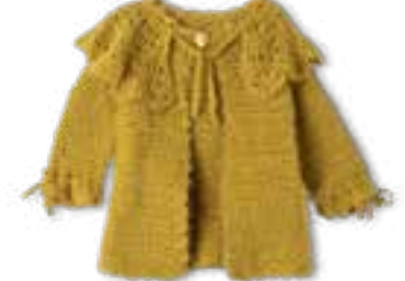
40 PER FORTUNA