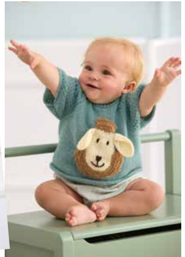
37 + 38 Schäfchen- und Fuchspullover – ECOPUNO