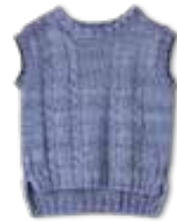
12 COOL WOOL VINTAGE