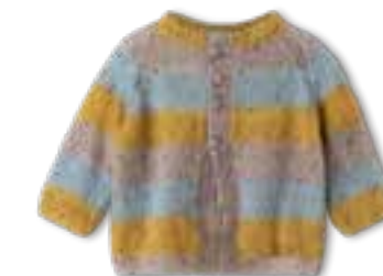
39 NATURAL SUPERKID TWEED