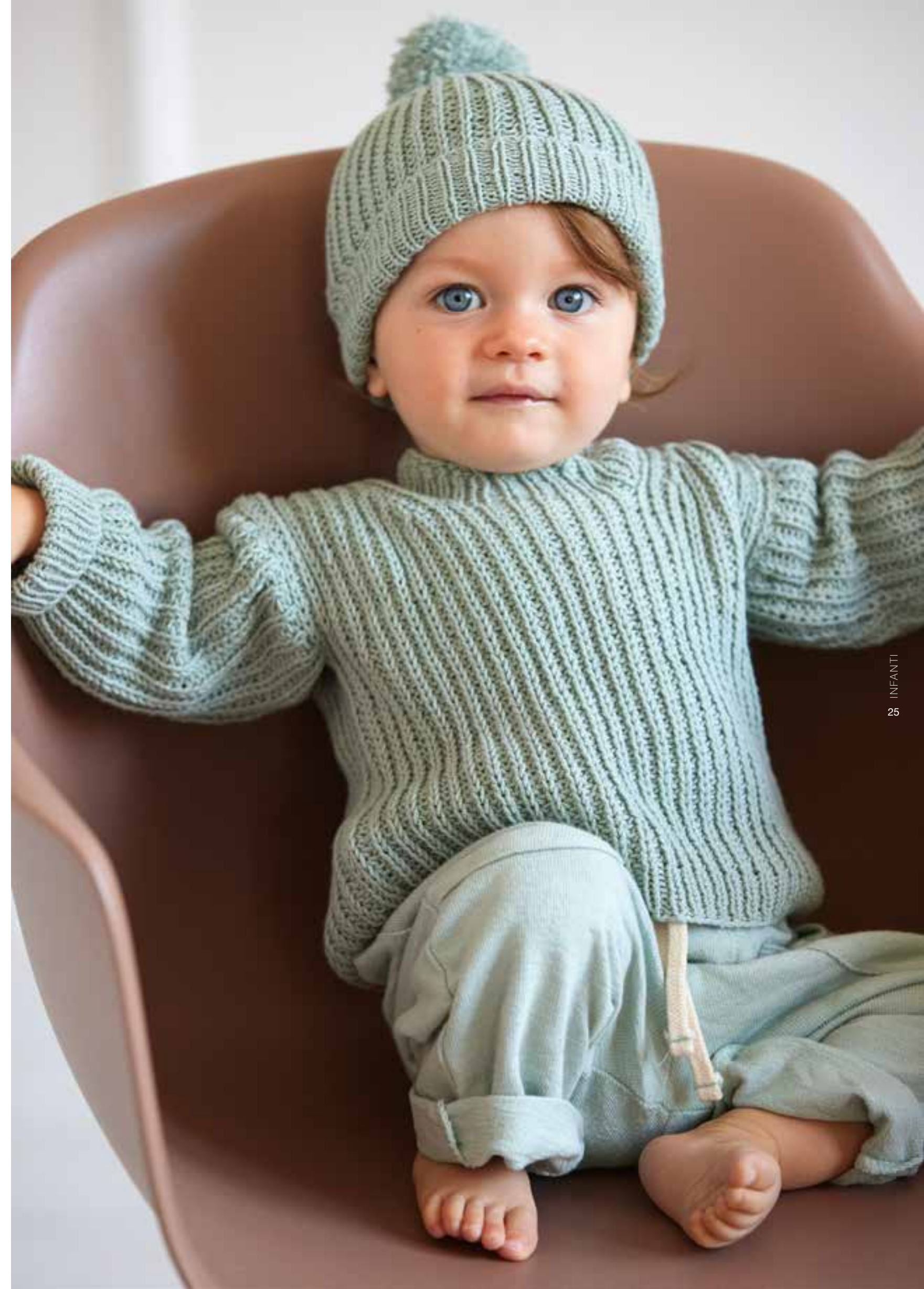
26 + 27 Mütze und Pullover – ELASTICO