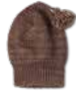
03 COOL WOOL BIG VINTAGE