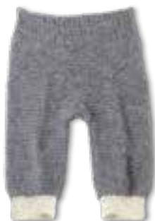
18 COOL WOOL BABY