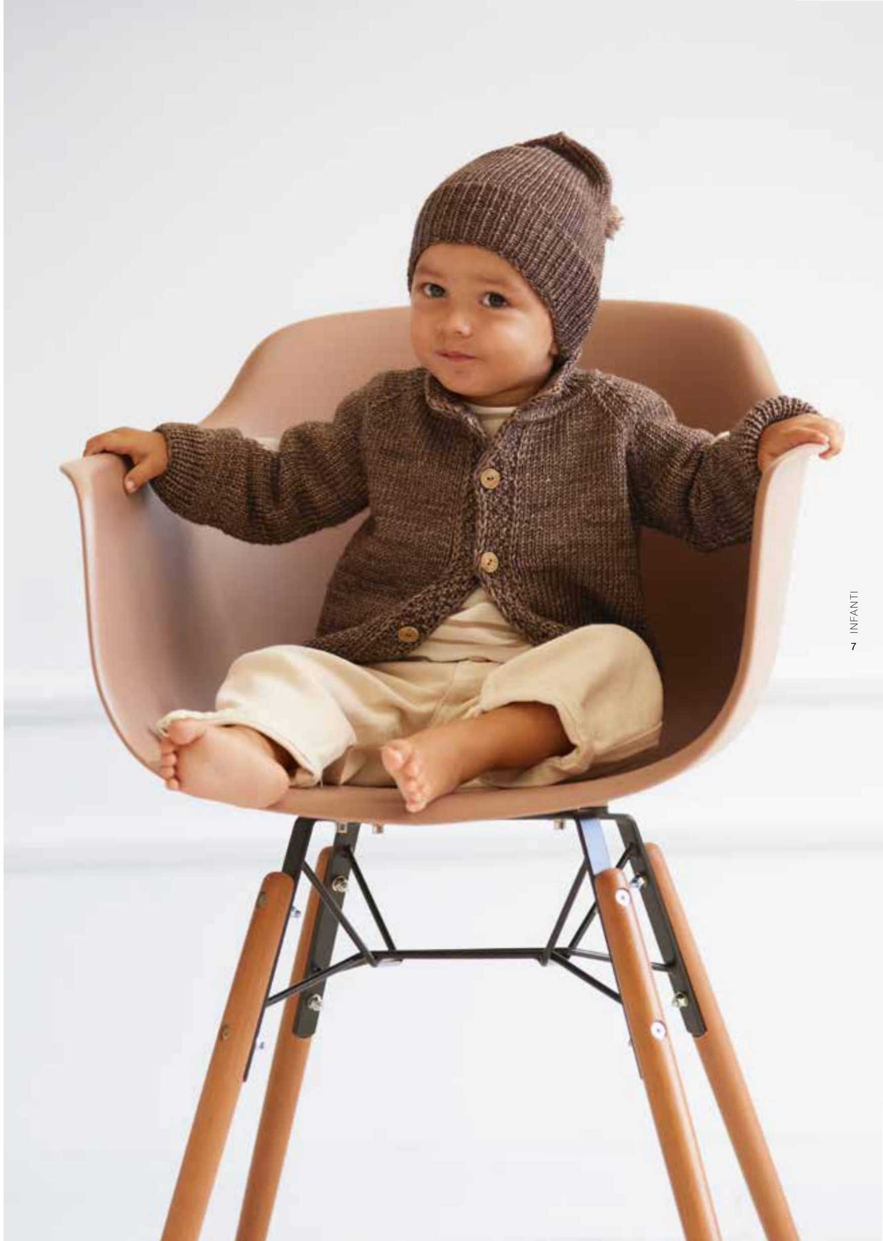
02 Pullunder – COOL WOOL BIG VINTAGE + COOL WOOL BIG 03 Mütze – COOL WOOL BIG VINTAGE | 04 Jacke – COOL WOOL BIG VINTAGE + COOL WOOL BIG