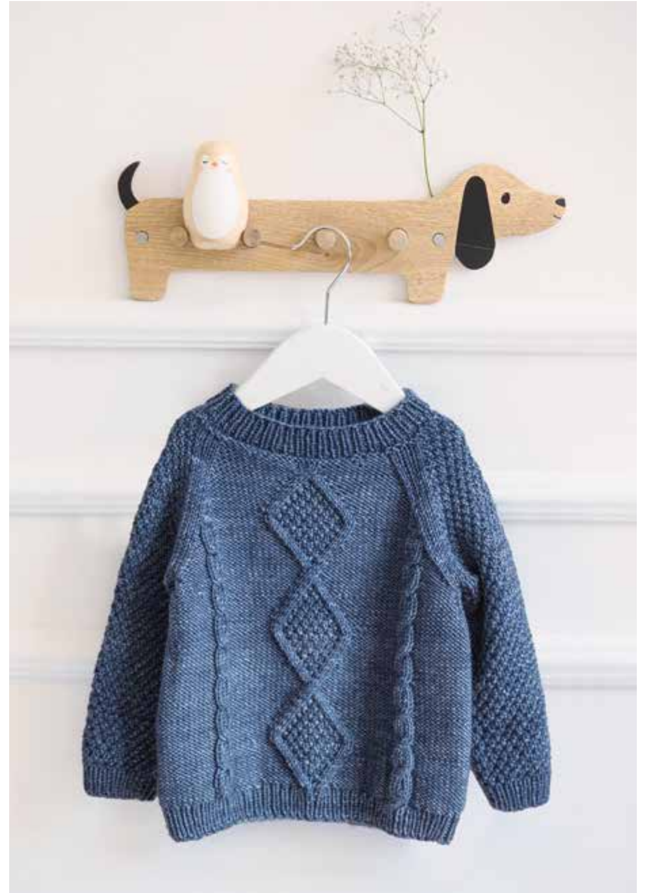
25 Pullover – COOL WOOL BIG VINTAGE